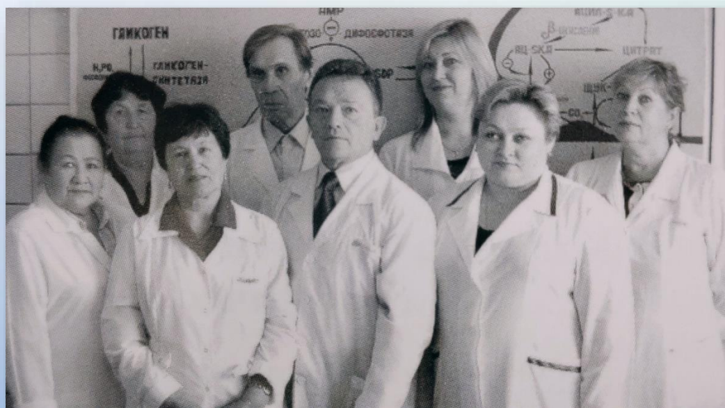
Коллектив кафедры, 2009 г.