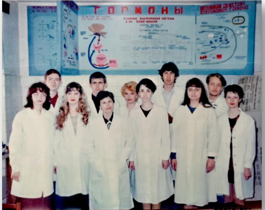
175 гр. май, 1995 г.